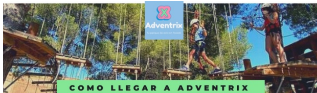
COMO LLEGAR A ADVENTRIX

Para facilitar la llegada y el aparcamiento, rogamos a los padres y madres que intenten organizarse para acceder al parque con el menor número de coches posible. Recordamos que para acceder a Adventrix hay que hacerlo desde la carretera de circunvalación (el valle), pues a menudo las indicaciones en Google Maps nos indican el acceso desde Cobisa por una carretera que NO ES TRANSITABLE . En el caso de venir desde el sur de Toledo, hay que bajar por el Parador hasta la ronda del Valle y subir por la carretera de la Pozuela ( HOTEL ABACERÍA ).